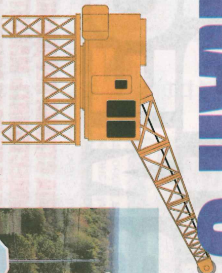
Сотни километров дорог было введено в строй за последние годы

Санкт-Петербург. Инновационно-производственный комплекс «ЗАО «ВЕРТЕКС», выпускающий социально-значимые лекарства.