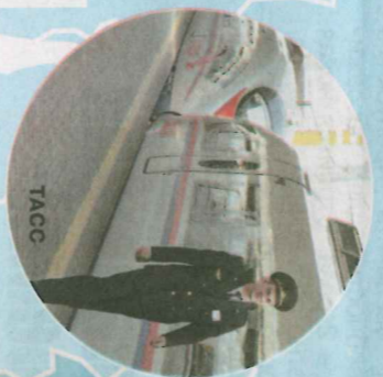
Скоростных поездов с каждым годом становится все больше

17 Свердловская область. В г. Североуральске веден в строй первый